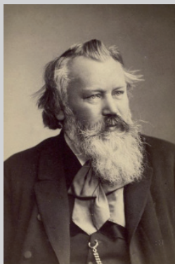
Johannes Brahms 1833 - 1897